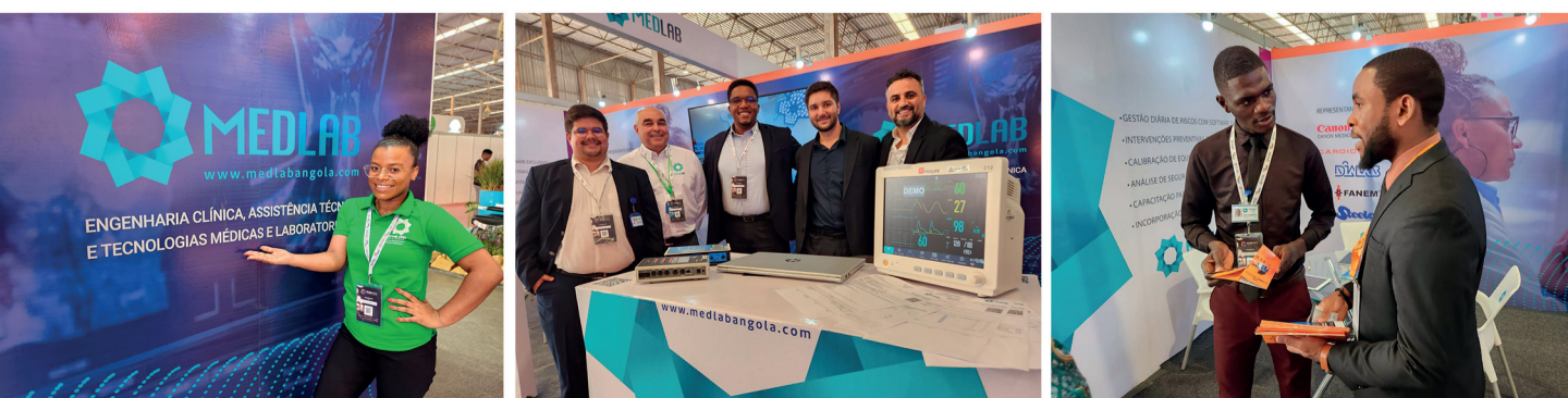
STAFF DA MEDLAB MARCA PRESENÇA NA FEIRA E PRESTA ATENDIMENTO ESPECIALIZADO AOS VISITANTES.